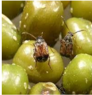
รูปที่ 1 ลักษณะโดยทั่วไปของด้วงถั่วเขียว