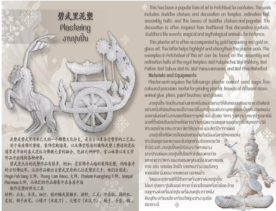
Figure 1 The sample of a guidebooks