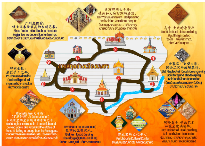
Figure 2 The sample of travel routes