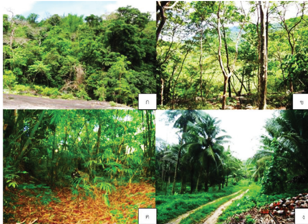
ภาพที่ 1 สภาพนิเวศในพื้นที่ศึกษา (ก) ป่าดิบชื้น (ข) ป่าดิบแล้ง (ค) ป่าเบญจพรรณ และ (ง) พื้นที่เกษตรกรรม