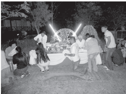
รูปงาน “บายศรีสู่ขวัญข้าวปั้นพาล้าง” ที่บ้านหุบเมย

4) กิจกรรมศูนย์การท่องเที่ยวเรียนรู้ มีวัตถุประสงค์เพื่อเป็นศูนย์กลางการท่องเที่ยวเรียนรู้วิถีชีวิตชุมชนและให้บริการแก่นักท่องเที่ยวและเป็นศูนย์การศึกษาเรียนรู้ด้านเทคโนโลยีสารสนเทศของเยาวชนในบ้านหุบเมย โดยใช้อาคารของโรงเรียนวัดหุบเมยเป็นศูนย์กลางการท่องเที่ยวเรียนรู้ นอกจากนี้มีการจัดทำสื่อประชาสัมพันธ์ แผ่นพับ และเว็บไซต์