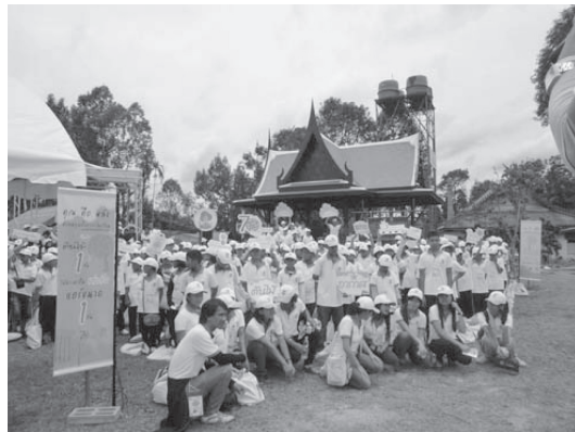
กิจกรรม “หนูน้อยนักร้อง พิทักษ์สิ่งแวดล้อม”

กุมภาพันธ์ 2552 และการเข้าไปทำกิจกรรม “หนูน้อยนักร้อง พิทักษ์สิ่งแวดล้อม” ของโรงงานยาสูบ จำนวน 200 คนเศษ เมื่อวันที่ 5 มิถุนายน 2552