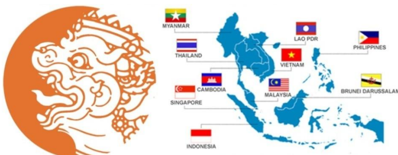
รูปที่ 1 แสดงภาพศูนย์กลางมรดกโลกกลุ่มอาเซียน ASEAN World Heritage Cluster

พร้อมกับเสนอเป็นแนวคิดในการอนุรักษ์และพัฒนา เพื่อให้ชุมชนสามารถรองรับการท่องเที่ยวเชิงวัฒนธรรมที่เกิดขึ้นหลังจากการอนุรักษ์แล้ว โดยไม่ให้เกิดการทำลายหรือลดทอนคุณค่าของสภาพแวดล้อม อีกทั้งมุ่งเน้นส่งเสริมการมีส่วนร่วมของชุมชน เพื่อให้การดำเนินการเป็นไปโดยความต้องการของชุมชน และส่งเสริมโครงสร้างทางสังคมของชุมชนและบริบทแวดล้อม โดยมุ่งหวังให้ชุมชนสามารถดำเนินไปได้อย่างยั่งยืน เพื่อให้แนวทางการพัฒนาอุทยานประวัติศาสตร์ สุโขทัย-ศรีสัชชนาลัย-กำแพงเพชร ตลอดจนถึงพื้นที่ต่อเนื่องโดยรอบเป็นไปอย่างเหมาะสม มีมาตรการและกลไกการอนุรักษ์ที่สอดคล้องกับวิถีชีวิตของชุมชนทุกรูปแบบ ทั้งชุมชนประวัติศาสตร์ ชุมชนวัฒนธรรม ชุมชนตลาด และชุมชนริมน้ำ เสริมสร้างการพัฒนาเศรษฐกิจและการท่องเที่ยวเชิงสร้างสรรค์ โดยภาคประชาชนมีส่วนร่วมทุกกระบวนการ ในการพัฒนา เพื่อให้เกิดการพัฒนาอย่างบูรณาการและยั่งยืน ที่สอดคล้องกับยุทธศาสตร์ตั้งแต่ระดับชาติจนถึงระดับท้องถิ่น ต่อเนื่องไปจนถึงการเชื่อมโยงแหล่งท่องเที่ยวมรดกโลกกับประเทศเพื่อนบ้าน เพื่อให้เกิดการรวมกลุ่มการท่องเที่ยว เป็นแกนแหล่งมรดกประวัติศาสตร์วัฒนธรรม โดยพัฒนาศักยภาพให้ประเทศไทยเป็นศูนย์กลางมรดกโลกกลุ่มอาเซียน ASEAN World Heritage Cluster สร้างความตระหนักและให้ความสำคัญต่อการอนุรักษ์และฟื้นฟูทรัพยากรการท่องเที่ยว แหล่งมรดกทางวัฒนธรรม ให้คงไว้ซึ่งความมีคุณค่าสืบต่อไปในอนาคต ดังรูปที่ 1