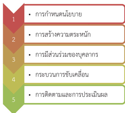
รูปที่ 2 ปัจจัยแห่งความสำเร็จในการเป็น USR

รอดัทสนา [14] กล่าวว่า ปัจจัยความสำเร็จของการก้าวสู่การเป็นมหาวิทยาลัยสีเขียวมีอยู่ 5 ปัจจัย ประกอบด้วย 1) การกำหนดนโยบายด้านสิ่งแวดล้อมที่มีความชัดเจนในการมุ่งสู่การเป็นมหาวิทยาลัยสีเขียว และครอบคลุมประเด็นด้านสิ่งแวดล้อมต่าง ๆ ได้แก่ การปรับปรุงโครงสร้างพื้นฐาน การลดการใช้พลังงาน การจัดการปัญหาการเปลี่ยนแปลงสภาพภูมิอากาศ การจัดการของเสีย การจัดการทรัพยากรน้ำ การปรับปรุงระบบการขนส่ง การจัดการศึกษาและวิจัย และการสร้างความตระหนัก 2) การมีส่วนร่วมของบุคลากรภายในและพื้นที่บริเวณโดยรอบสถาบันการศึกษา ตลอดจนการแต่งตั้งคณะทำงาน 3) การกำหนดตัวชี้วัด เป้าหมาย และการติดตามประเมินผลการดำเนินโครงการหรือกิจกรรมตามนโยบายสิ่งแวดล้อมในแต่ละด้านของแต่ละปีอย่างชัดเจน 4) การบูรณาการกิจกรรมหรือโครงการด้านสิ่งแวดล้อมเข้ากับการดำเนินงานตามพันธกิจในแต่ละด้าน และ 5) การพัฒนาเพื่อเพิ่มศักยภาพในด้านการจัดการสิ่งแวดล้อมอย่างต่อเนื่อง ตลอดจนนำองค์ความรู้และเครื่องมือใหม่ ๆ มาใช้ เช่น การจัดซื้อจัดจ้างสีเขียว การจัดทำคาร์บอนฟุตพริ้นท์ขององค์กร เป็นต้น ดังนั้น ปัจจัยแห่งความสำเร็จในการออกแบบสถาบันการศึกษาที่มีส่วนร่วมกับความรับผิดชอบต่อสังคม ประกอบด้วย 5 ปัจจัย คือ