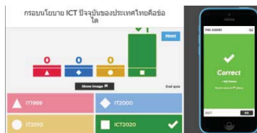
รูปที่ 9 แสดงจำนวนนักศึกษาที่ตอบคำถามถูกและผิด

เมื่อสิ้นสุดการตอบคำถามในแต่ละข้ออาจารย์ผู้สอนสามารถทราบจำนวนนักศึกษาที่ตอบคำถามถูกและผิดพร้อมทราบคะแนนสะสมในแต่ละข้อ