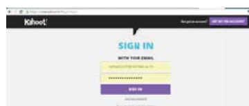
รูปที่ 6 หน้าจอการเข้าใช้งาน create.kahoot.it

นอกจากนี้แล้วยังมีเทคโนโลยีสารสนเทศและการสื่อสารที่ใช้สำหรับประเมินผู้เรียนบนอุปกรณ์ต่าง ๆ ผ่านระบบเครือข่ายอินเทอร์เน็ตฟรีไม่มีค่าใช้จ่าย โดยอาจารย์ผู้สอนสามารถเข้าไปตั้งคำถามได้ที่ https://create.kahoot.it โดยทำการสมัครสมาชิกเพื่อเข้าใช้งานรายละเอียดดังรูปที่ 6