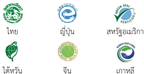
รูปที่ 4 ฉลากสิ่งแวดล้อม (Eco-Label)