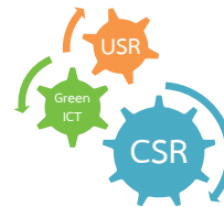
รูปที่ 1 ความสัมพันธ์ระหว่าง USR กับ CSR

รายงานด้านสังคมและสิ่งแวดล้อม [10] ส่วนมหาวิทยาลัยที่มีความรับผิดชอบต่อสังคม เรียกอีกอย่างว่า University Social Responsibility (USR) เป็นแนวคิดเกี่ยวกับความรับผิดชอบต่อสังคมของมหาวิทยาลัย ต่อลูกศิษย์ นักศึกษาของตนเอง และสังคมชุมชนที่อยู่ในเขตบริการของมหาวิทยาลัย เพื่อรับใช้หรือตอบสนองสังคมชุมชนในรูปของบริการวิชาการที่ตนเองถนัด เชี่ยวชาญ ถ่ายทอดองค์ความรู้ที่เกิดจากการศึกษาวิจัยให้กับสังคมหรือตอบสนองสังคมเชิงช่วยเหลือแบบพึ่งพาอาศัยกัน ใช้โอกาส และความได้เปรียบให้เป็นประโยชน์ต่อสังคมโดยไม่หวังผลตอบแทนหรือให้เปล่าตามสมควรแก่ฐานะของตนเอง [11] ทั้งนี้ การเป็นมหาวิทยาลัยที่มีความรับผิดชอบต่อสังคม (USR) จะต้องประกอบด้วย 1) ตอบสนองความต้องการของสังคม 2) สื่อสารกับสังคม/รับใช้สังคม 3) ความเสมอภาคในโอกาสการเข้าถึงอุดมศึกษา และ 4) ลดปัญหาความเสียเปรียบในสังคม [12] ดังนั้น การนำเทคโนโลยีสารสนเทศและการสื่อสารที่เป็นมิตรกับสิ่งแวดล้อม (Green ICT) มาใช้ในองค์กรหรือสถาบันการศึกษา สามารถส่งเสริมและสนับสนุนให้องค์กรหรือสถานศึกษาที่มีส่วนร่วมกับความรับผิดชอบต่อสังคมได้เช่นกัน