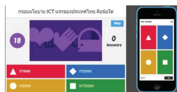
รูปที่ 8 แสดงการตอบคำถามของนักศึกษา

นักศึกษาที่ตอบคำถามจะต้องอ่านคำถามบนหน้าจอที่อาจารย์ผู้สอนแสดงให้เห็น ส่วนการตอบคำถามนักศึกษาจะต้องตอบคำถามบนอุปกรณ์ต่าง ๆ ที่นักศึกษาใช้งานอยู่ในรูปแบบของสัญลักษณ์และสีที่เป็น 4 ตัวเลือก